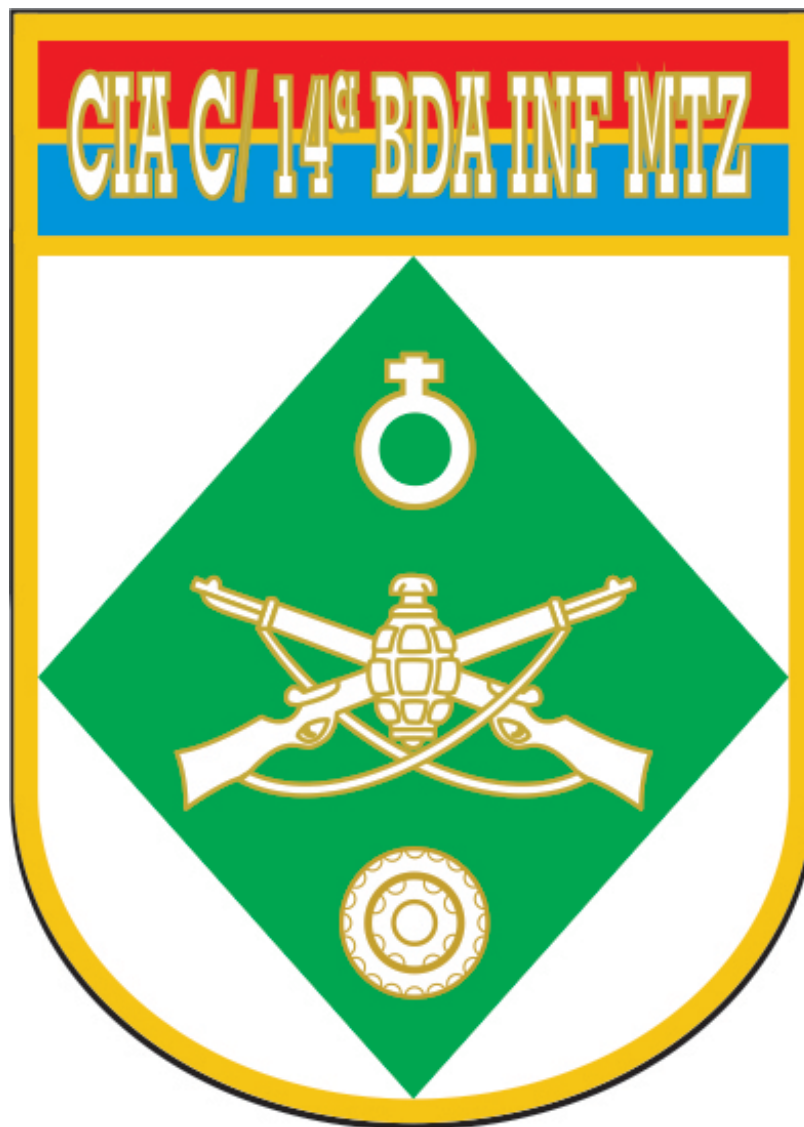
Exemplo de DOM de Brigada com o escudete filetado de vermelho.